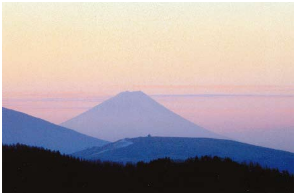
心に残る感動の瞬間。

発行所 東京都製紙原料協同組合 台東区台東 3-16-1 TEL (3831) 7980 発行人 近藤 勝 編集広報委員会